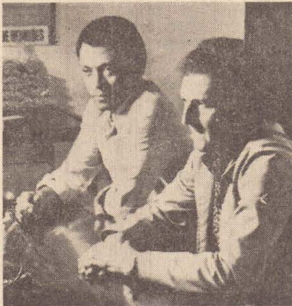
tituto de Criminalística vou abrir um processo sumario, acusando a Lotus de negligência indiciando, a em lesão corporal culposa".