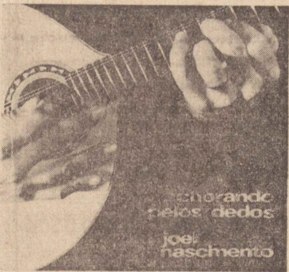
UM SR. BANDOLIM