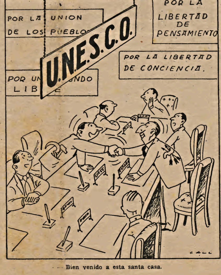
Bien venido a esta santa casa.

Su falta de fondo político, su bajo nivel cultural sería explicable y hasta perdonable. Lo que no puede ser perdonado al régimen de Franco es la situación de decadencia moral en que ha hundido y sigue hundiendo a la nación.