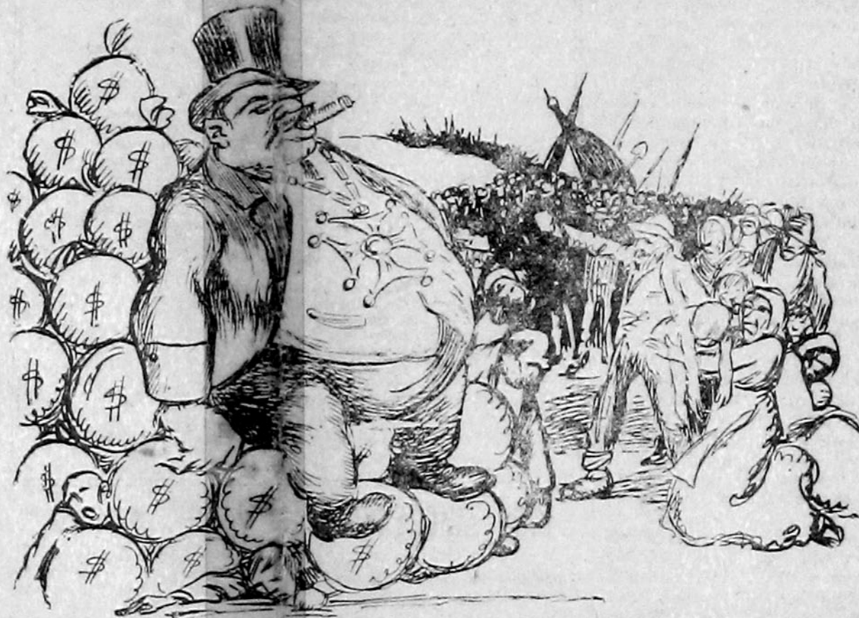
IGUALDADE E FRATERNIDADE

Rumo á Revolução Social vai, alfim, a humanidade, em busca da liberdade e do bem-estar mentirosamente prometidos, através dos seculos, por todas as religiões e pelas multiformes organizações politicas que a têm mantido em perennal servidão.