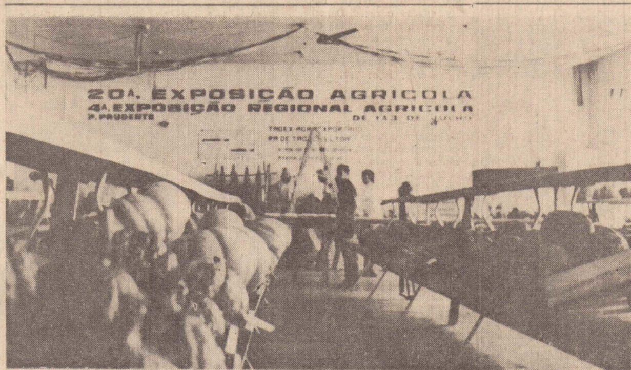
Exposição mostrará a força da agricultura regional