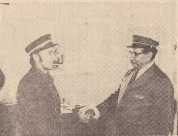
A despedida do chefe e amigo da estação