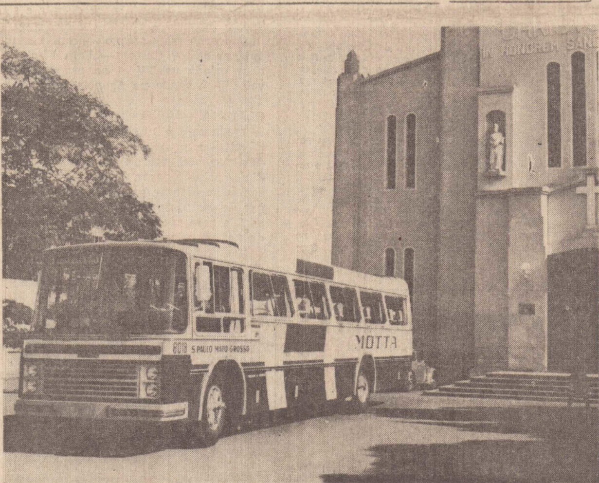
60 onibus com este estão sendo incorporados à frota da Viação Motta

Além de muitas variedades de legumes, estarão expostas flores, pequenos animais e aves. Como ocorreu nos eventos anteriores, acredita-se que tudo será visto por milhares de pessoas. Quem desejar, poderá adquirir os produtos, entre os quais vários a disposição do público na cidade somente nesta época.