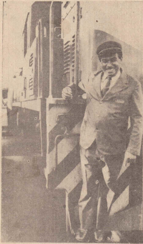
Uma pose de despedida na composição de luxo que à tarde partia para a capital