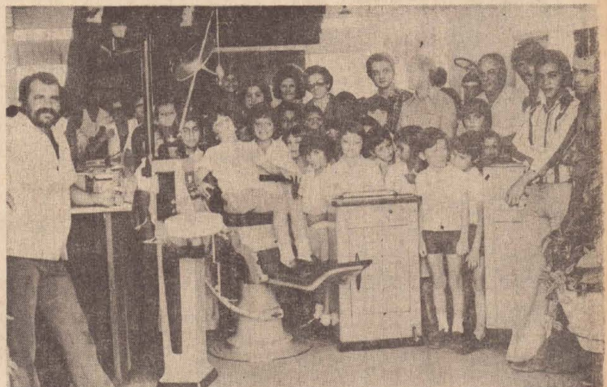
Uma festa na escola o recebimento do consultório dentário

Foi aberto inquérito, e naturalmente continuarão ser ouvidas as testemunhas, sobre mais um lamentável fato ocorrido na cidade de Anhumas, que sempre está no noticiário, em virtude dos acontecimentos que lá ocorrem.