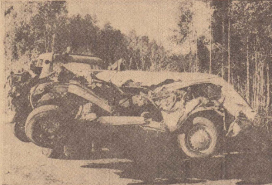
A Variant foi transformada num monte de ferros e latas retorcidas.