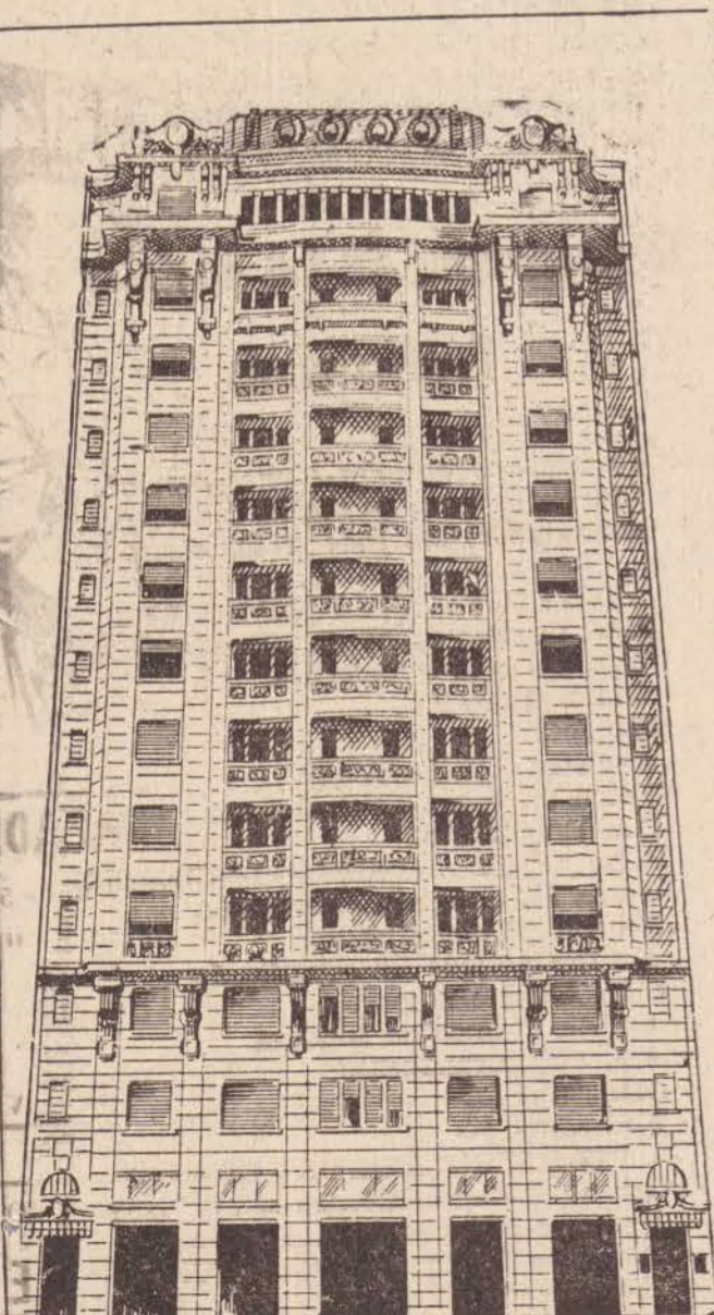
São Paulo - Lux Hotel