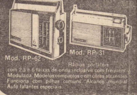
Mod. RP-62 Rádio portátil com 2,3 e 6 faixas de onda inclusive com frequência Modulada. Modelos compactos e em cores atraentes. Funciona com pilhas comuns. Alcance mundial. Auto falantes especiais.