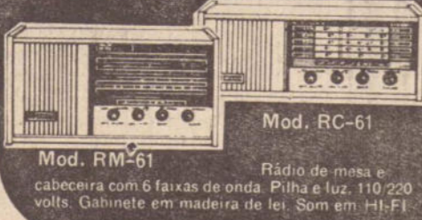
Mod. RC-61 Rádio de mesa e cabeceira com 6 faixas de onda. Pilha e luz. 110/220 volts. Gabinete em madeira de lei. Som em HI-FI.