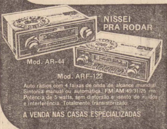
Mod. AR-44 Auto rádios com 4 faixas de onda de alcance mundial. Sintonia manual ou automática. FM/AM 49/31/25 ms. Potência de 5 watts, sem distorção e sem ruídos e interferência. Totalmente transistorizado.

Não é nada boa a situação do Santos dentro do certame brasileiro, tendo conquistado até agora somente duas vitórias, contra a Desportiva e Alagoano, empatando duas vezes contra Goiás e Vasco. Os demais jogos apontaram derrota para o time da Vila Belmiro.