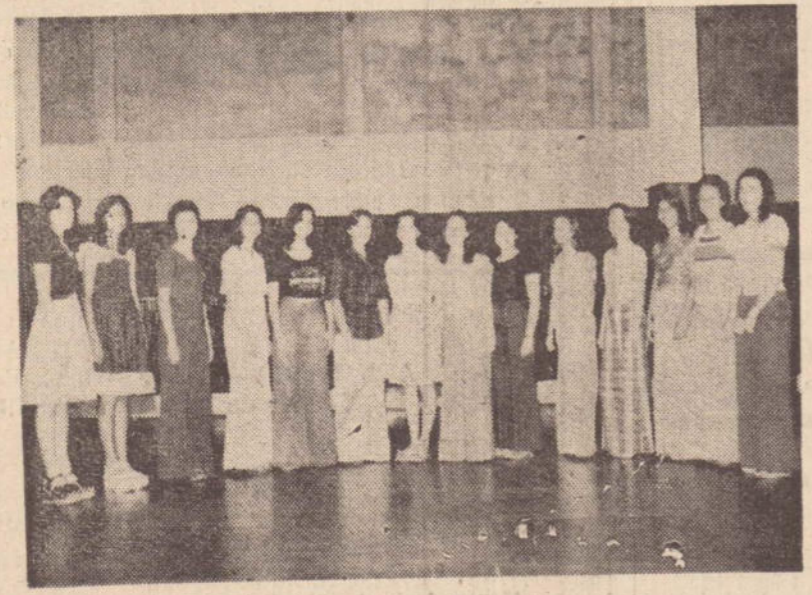
As debutantes de 1975, na cidade de Santo Anastácio.