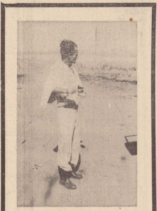
Desolado, o lavrador observa as pastagens e lavouras ressequidas enquanto o pão-de-cada-dia já lhe é escasso.