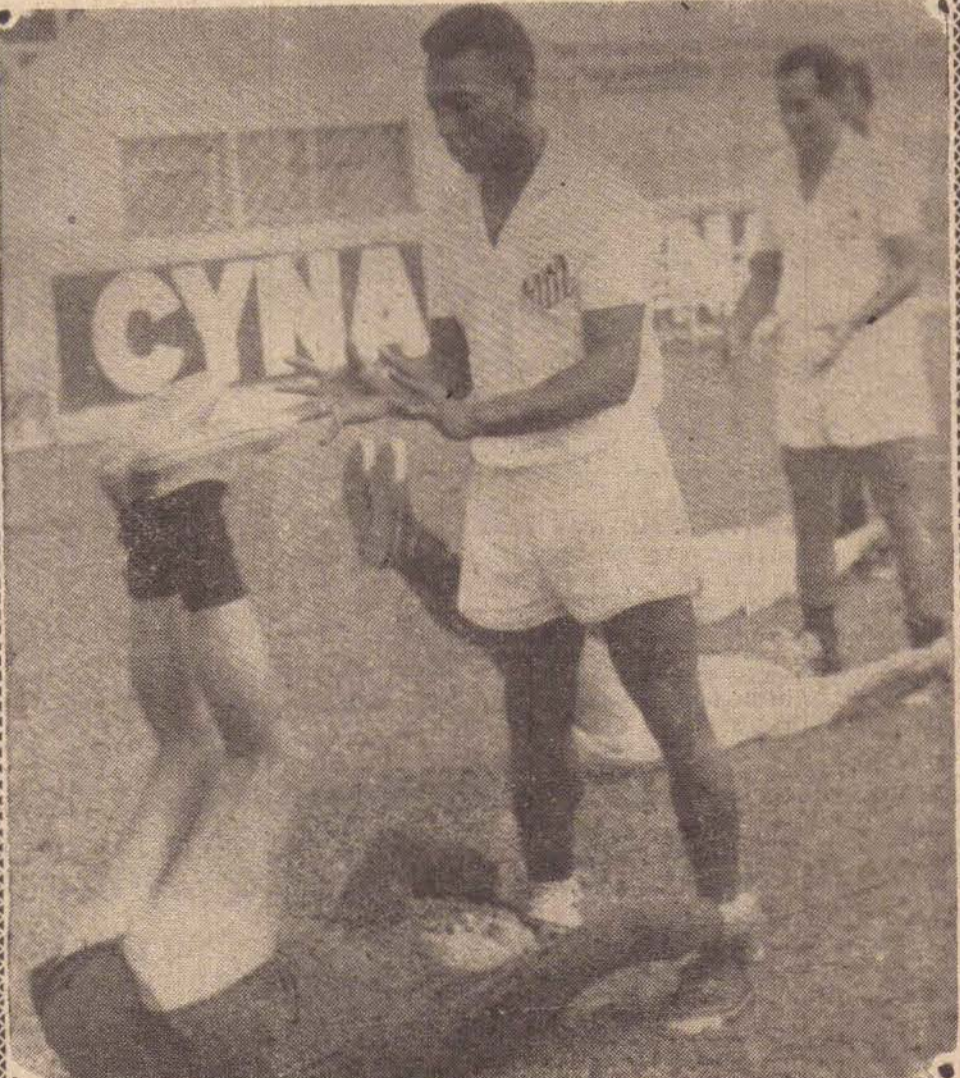
O "REI" sendo saudado respeitosamente por um vassalo Santista...