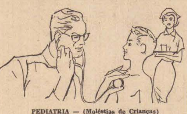
PEDIATRIA - (Molestias de Crianças)