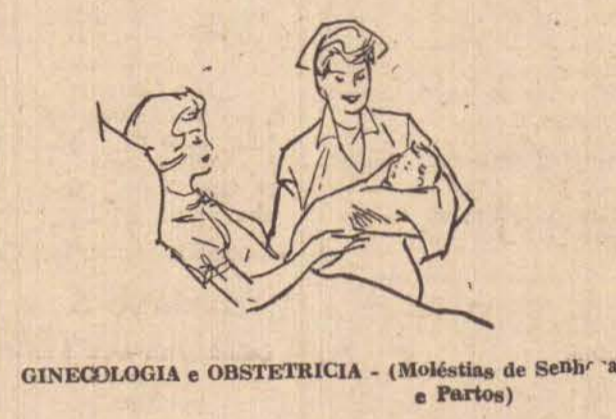
GINECOLOGIA e OBSTETRICIA - (Moléstias de Senhoras e Partos)