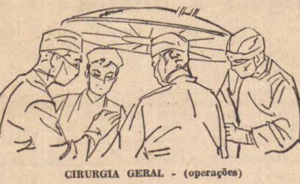
CIRURGIA GERAL - (operações)

Toda a tendência giraria em torno de uma melhor remuneração para a assistência à maternidade, desobediendo as entidades, que agora se negam, a um pagamento de acordo com a tabela do DNPS, o que se justificaria, desde que não fosse visto o caso humanitário de cada segurado, levando-se em conta apenas a situação do Instituto, desde que a negação foi categórica, sem prazo algum, obedecendo objetivo imediato.