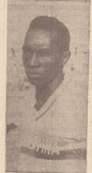
CARÃO, que teve apenas um ano, com fase extraordinária foi depois de um tempo crítico, relegado totalmente ao esquecimento. Cansou de ficar sentado e resolveu ir procurar outro clube, para ter a varantia do seu futuro.