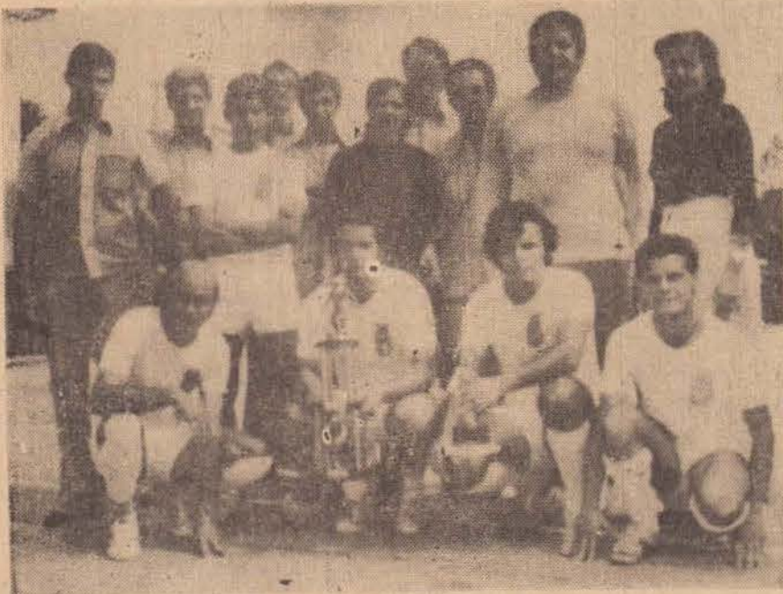
A equipe de Martinópolis exhibe os troféus à reportagem