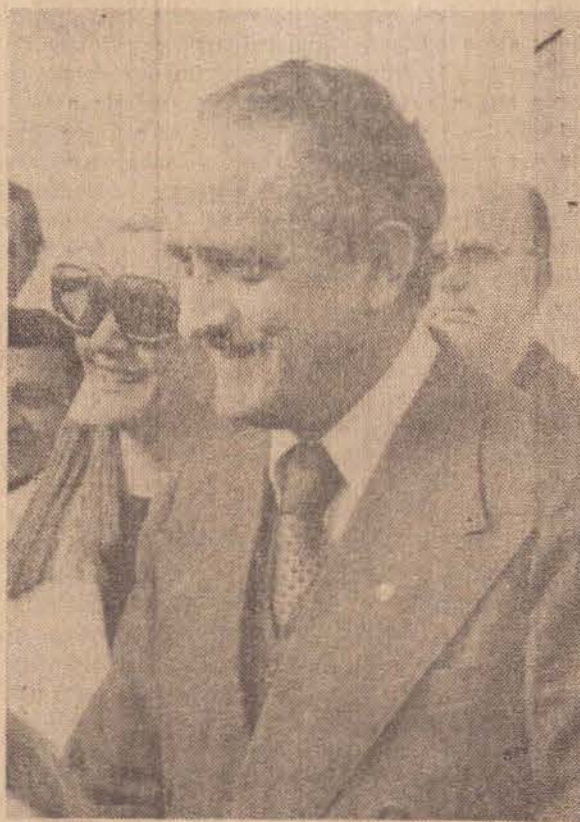
Ministro Arnaldo Prieto, do Trabalho

As mulheres e crianças porém não tem mercado de trabalho e para ajudar no sustento da casa, são obrigadas a recorrer a lida do campo. Por isso, quando começam as colheitas aumenta a procura de empregadas domésticas, porque muitas delas preferem ganhar dinheiro na colheita de algodão, amendoim e tomate, só retornando quando não houver mais serviços na zona rural.