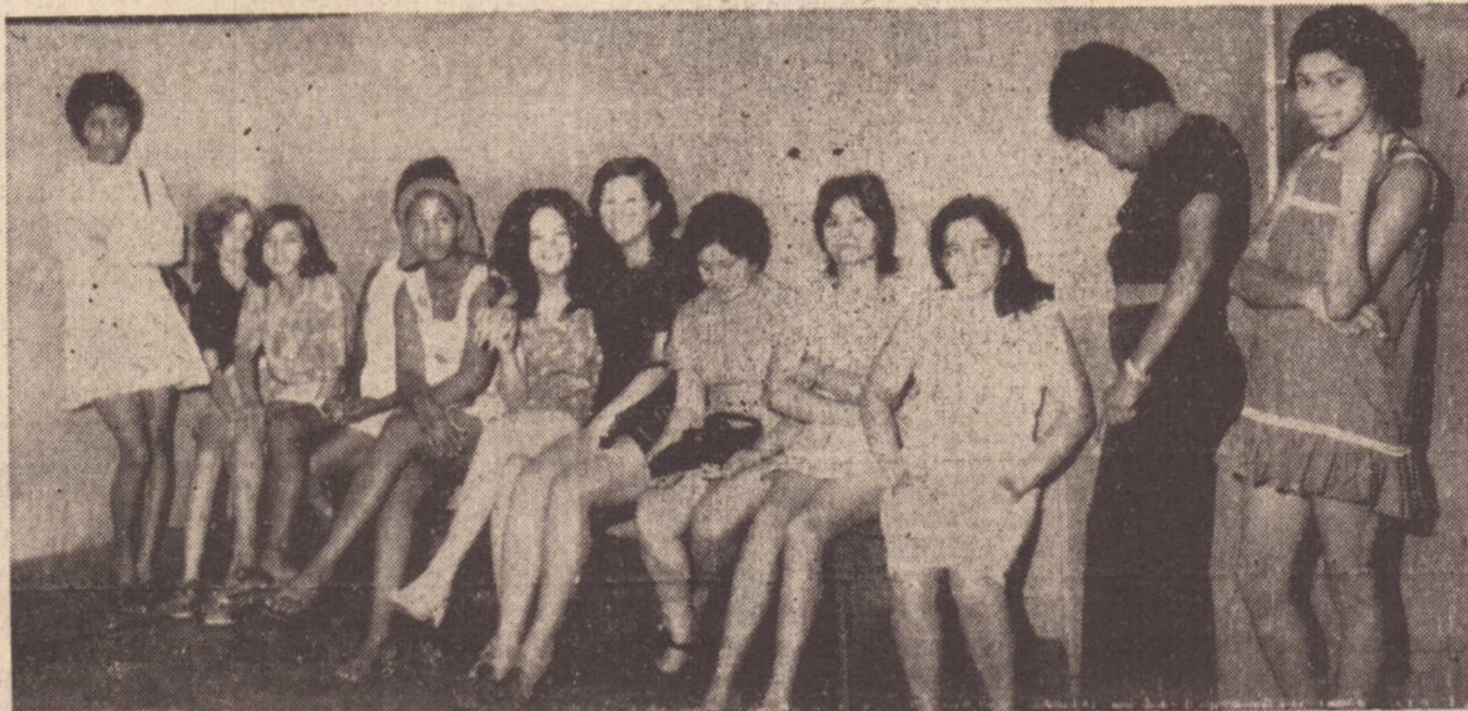
Na polícia elas tiveram a noite passada um "chá de banco" por várias horas.

Atendendo a uma solicitação formulada por centenas de famílias de Presidente Prudente, a Polícia realizou ontem uma "blitz" pela cidade, recolhendo dezenas de "mariposas" que desafiam a moral e os bons costumes, causando vexame aos que saem as ruas para efetuar suas compras no comércio à noite.