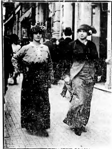
✧ ✧ ✧ Pelos nossos Cinemas (Observações a vol d'oiseau IV Brasil Cinema

O Brasil é, actualmente, o mais chic e confortavel cinema da nossa urbs , como já devem saber os meus leitores, e, mais ainda, as minhas leitoras amigas.