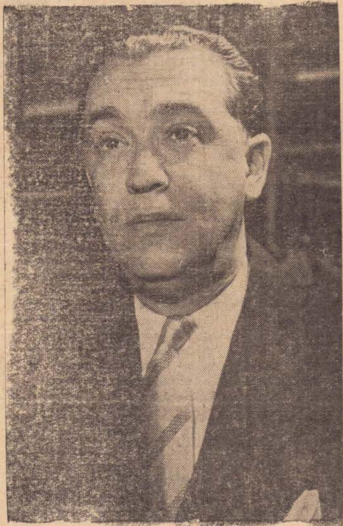
JUSCELINO RETORNOU AO PAIS E IMEDIATAMENTE INICIOU CAMPANHA — O ex-presidente Juscelino Kubitschek de Oliveira regressou ao país e, após rápida visita a Belo Horizonte, no último sábado, onde foi entusiasticamente recebido, numa das maiores manifestações populares de que se tem notícia na capital mineira, se dirigiu para Goiânia, no dia imediato, onde iniciou sua campanha eleitoral para a disputa da senatória, pelo Estado de Goiás. O comício que realizou na praça dos Bandeirantes, contou com a presença de milhares de pessoas, ávidas por ouvir as palavras de JK. "Liberdade e Desenvolvimento", eis o lema de sua campanha eleitoral.