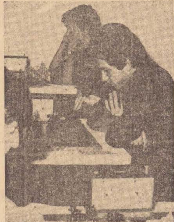
Equipe de Enxadristas de P. Prudente e Amepp, já em sua nova casa.

A equipe de Xadrez de P. Prudente e os enxadristas tem agora um local adequado para seus treinamentos e torneios. Numa