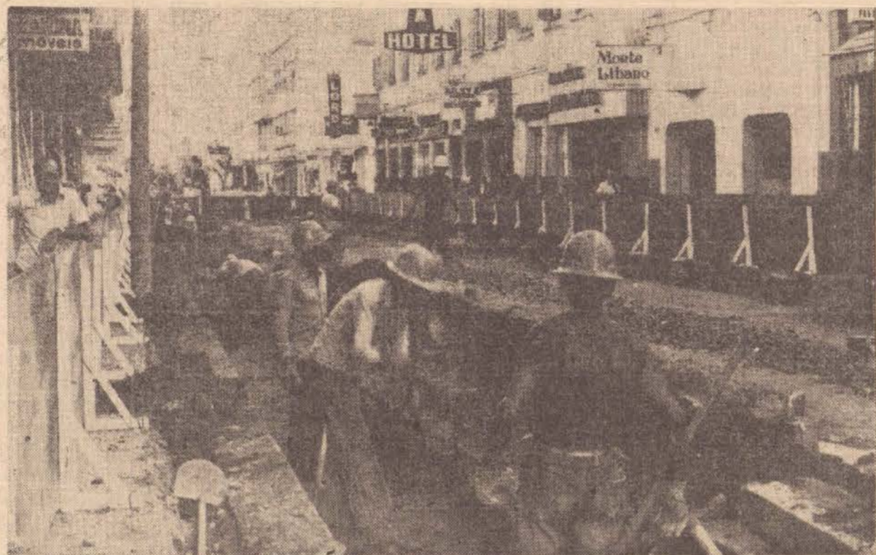
Até o Natal, toda a Nicolau Maffei, terá em definitivo a sua Rua de Pedestres.

O embaixador iraquiano disse ainda que o petróleo é uma arma que pode e deve ser usada em favor da causa árabe. "Não se trata da questão de preços, este é um assunto que depende da economia mundial, inflação, aumento dos produtos manufaturados, que os países árabes importam. Quanto à decisão de vender ou não petróleo a este ou aquele país, este é um dado político que pode ser utilizado com uma arma pelos países produtores de petróleo, em favor dos legítimos interesses do povo árabe em geral e dos palestinos em particular".