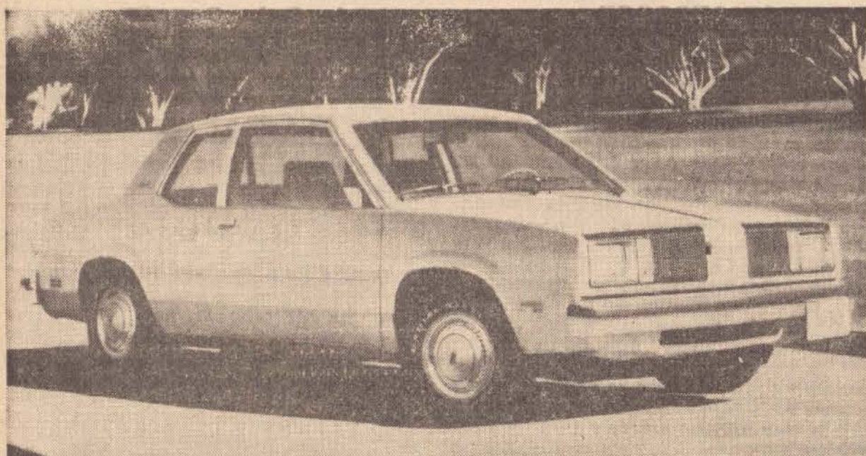
O Omega 80, um carro mais leve e mais econômico da GMC norte-americana.

Considerado pela GMC uma nova marca na indústria automobilística norte-americana, uma outra versão do "carro X", denominação que a empresa deu ao seu novo veículo subcompacto de tração dianteira e motor transversal, é agora lançada pela divisão Oldsmobile. Trata-se do "Omega 1980", modelo que representa a quarta geração de veículos subcompactos redimensionados daquela divisão. Em relação aos modelos 79, o Omega é cerca de 340 quilos mais leve, o que proporciona uma economia de combustível de mais de 2 km por litro.