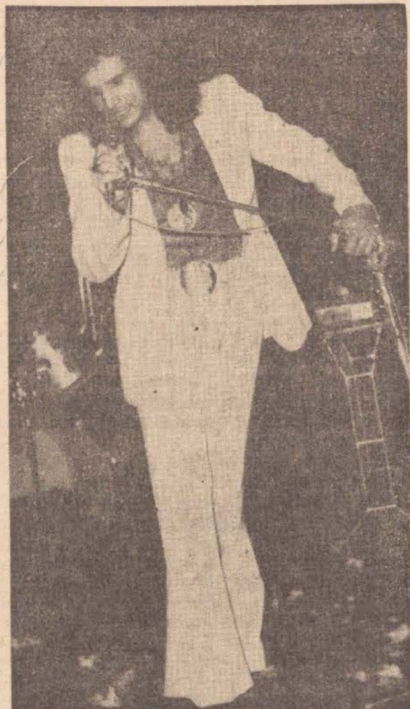
plifica sua permanência no estrelato por tantos anos.

Antes mesmo de aparecer, ainda atrás da cortina, já se pressente sua entrada. Quando o foco o ilumina, de roupa branca, apenas confirma-se esse pressentimento, próprio de um artista carismático. Uma das razões que ex-