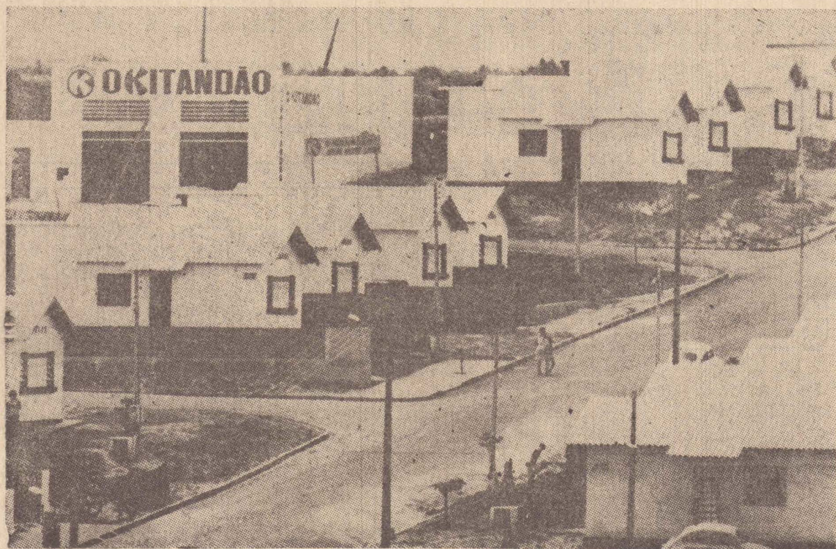
Moradores acusam vereadores.