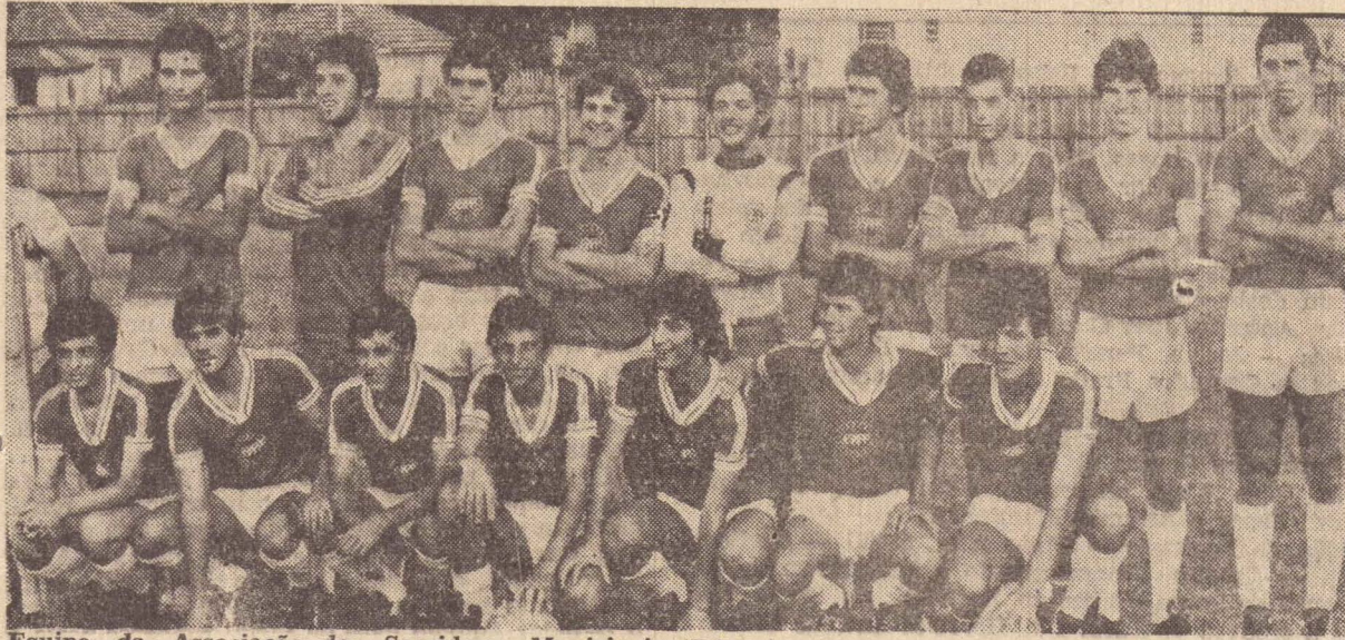
Equipe da Associação dos Servidores Municipais "B", campeã juvenil de 1981.