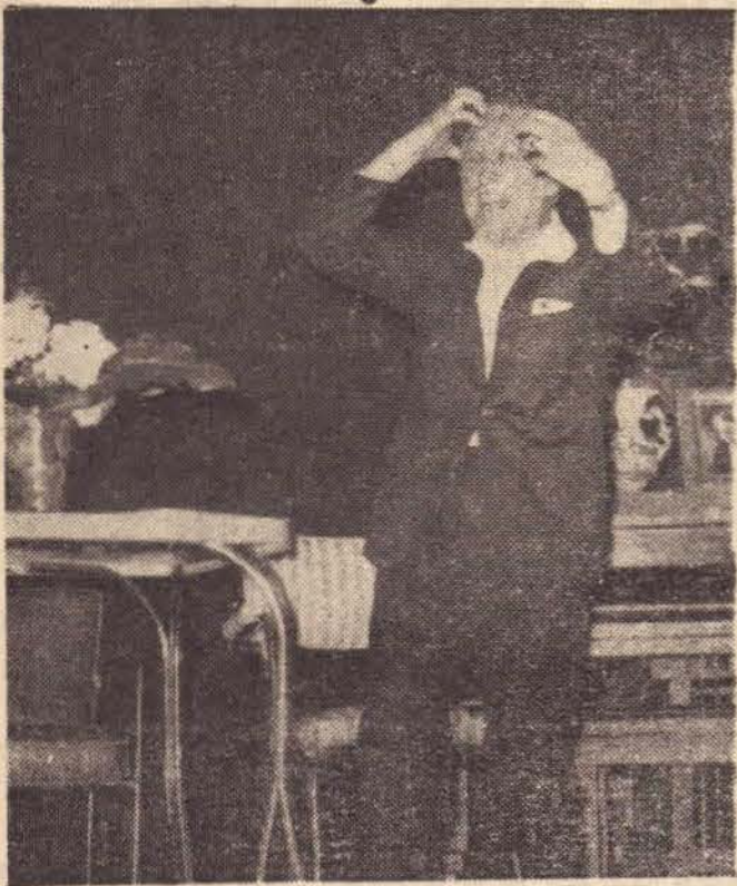
Um flagrante do Monólogo, quando o pintor descobre a falta de sua mulher