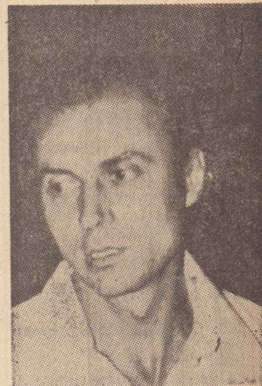
Suplicy: "Ainda há muita coisa para ser esclarecida"

Por sua vez, Suplicy disse que não há o que apostar pois esta investigando a denúncia, afirmando que "é fato que o deputado Armando Pinheiro conseguiu empréstimo de mais de 9 milhões de cruzeiros junto ao Banespa, a juros de 5% ao ano e mais 28% de correção monetária também ao ano. E mais: no caso de atraso de pagamento, o juro de mora será de 1%.