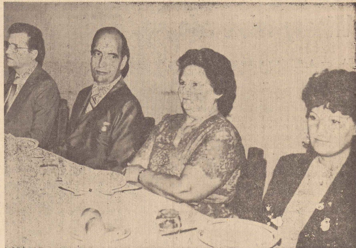
O homenageado, na mesa principal

ciais, autoridades e pessoas especialmente convidadas. Todos os detalhes estão na página 5