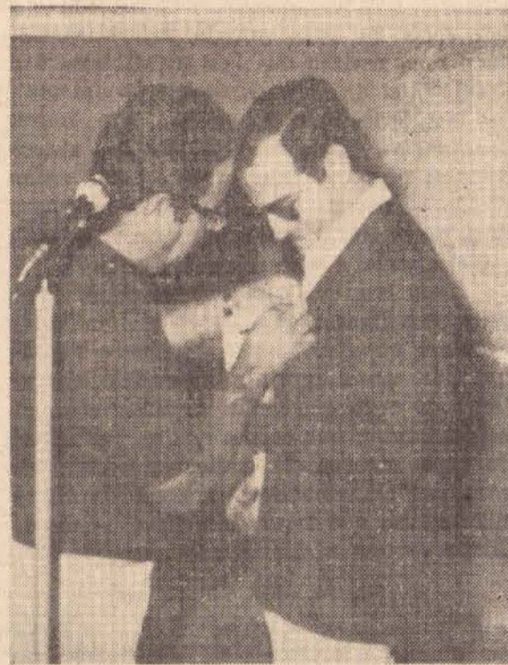
No encerramento um dos participantes do curso recebendo sua medalha. Foram distribuídos também diplomas de participação.

Sexta feira dia 25 de maio, foi o encerramento da Semana da Prevenção de Acidentes, na Empresa de Transportes Andorinha, quando desde o dia 21 de maio, com a presença de funcionários e diretores, foram pronunciadas palestras abordando diversos assuntos ligados à prevenção de acidentes.