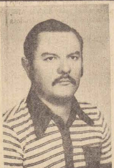
Prefeito Orivaldo Rayzaro, o protótipo do homem público, cuja gestão à frente da Prefeitura Municipal de Piqueroi, tem sido marcada por um sem número de obras, que caracterizam seu arrojo e desprendimento.