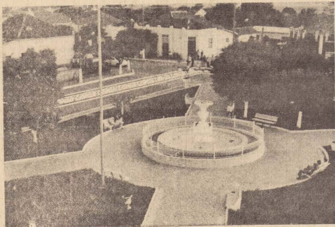
Em todos os municípios do porte de Piqueroi, aos 31 anos de sua emancipação político-administrativa, a cidade de Orivaldo Rayzaro oferece à sua pacata e ordeira população recantos agradáveis de lazer. Um deles, é a Praça Matriz, que aí aparece, com o seu verde e a fonte central.

Nesta data, há 31 anos, Piqueroi adquiriu sua emancipação político-administrativa.