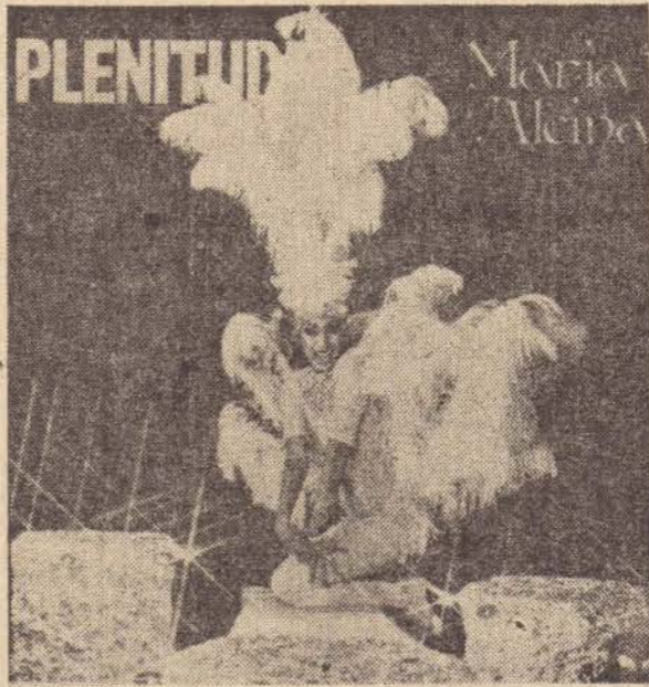
MARIA ALCINA EM PLENITUDE