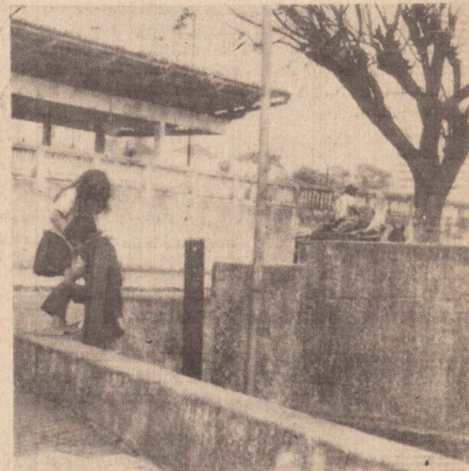
Nossa estrutura administrativa não oferece para solucionar o grave problema.