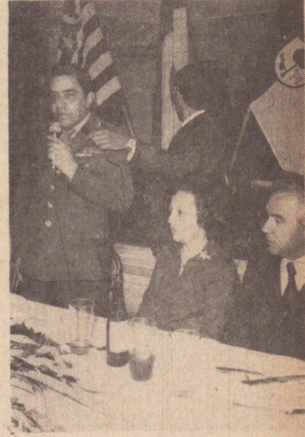
No Venceslau Clube o Comte. da II Região agradece a recepção