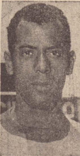
Carlos Albreto, o grande capitão da seleção brasileira de 1970, estará em nossa cidade, dia 8 de novembro.

O grande acontecimento esportivo será no dia 8 de novembro, sábado, a partir das 21 horas, no Ginásio Municipal de Esportes, e os ingressos já estão sendo vendidos nos seguintes locais — Gráfica Depieri, Radio Comercial, Brasimac, Modulinea, Otica Precisa, Radio Piratininga, A Tropical, Padaria Luzitana, Empresa de Transportes Brasília, Casa Lotérica Sandoval & Petry, e também em nossa redação, no horário comercial.