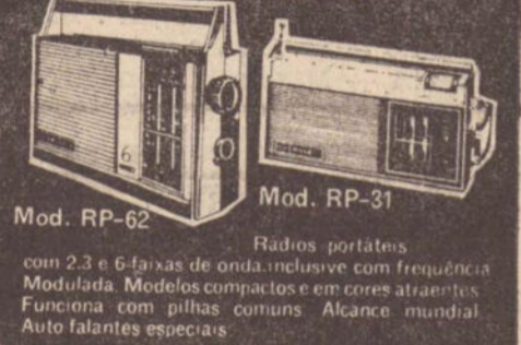
Mod. RP-62 Radios portáteis com 2,3 e 6 faixas de onda, inclusive com frequência Modulada. Modelos compactos e em cores atraentes. Funciona com pilhas comuns. Alcance mundial. Auto falantes especiais. Mod. RP-31