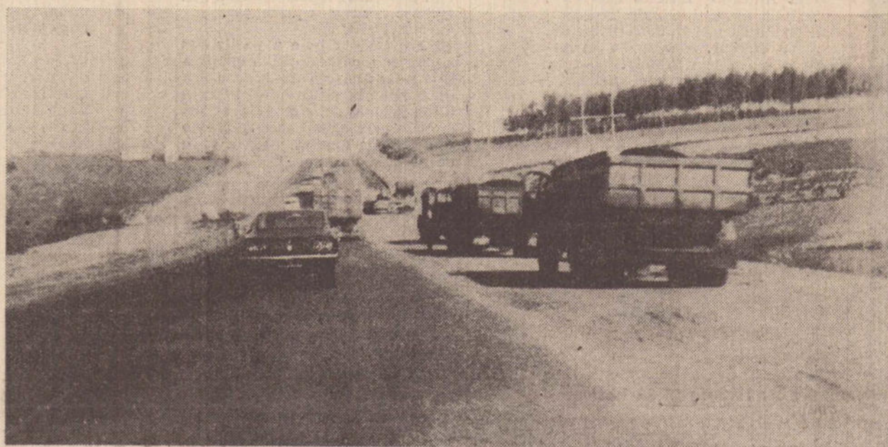
Logo o famigerado trecho entre Prudente e Bernardes estará totalmente recuperado