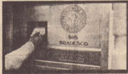
SOS BRADESCO dinheiro dia e noite

O Caixa Automático SOS Bradesco é dinheiro à sua disposição 24 horas por dia. Inclusive aos sábados, domingos e feriados. Ele garante a sua tranquilidade nos fins de semana, compras, passeios ou em qualquer emergência.