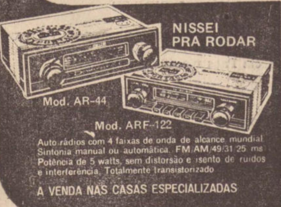
Mod. AR-44 NISSEI PRA RODAR Mod. ARF-122 Auto rádios com 4 faixas de onda de alcance mundial. Sintonia manual ou automática. FM AM 49,31 25 ms. Potência de 5 watts sem distorção e isento de ruídos e interferência. Totalmente transistorizado. A VENDA NAS CASAS ESPECIALIZADAS