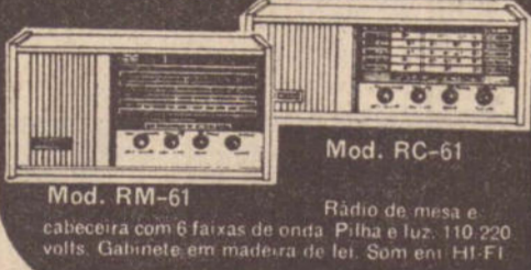
Mod. RC-61 Rádio de mesa e cabeceira com 6 faixas de onda. Pilha a luz. 110/220 volts. Gabinete em madeira de lei. Som em HI-FI. Mod. RM-61

■ O presidente da Federação Colombiana de Futebol, Alfonso Senior disse pouco depois de regressar a Bogotá, juntamente com o selecionado nacional, que só aceitará uma partida de desempate com o Peru, pela decisão da Taça América, se o jogo for hoje em um país neutro. Senior afirmou que a delegação da Colômbia vai esperar em Bogotá até hoje ao meio dia uma decisão da Confederação Sul Americana de Futebol e se a sua exigência não for aceita, reclamará a vitória por força da não apresentação da seleção do Peru.