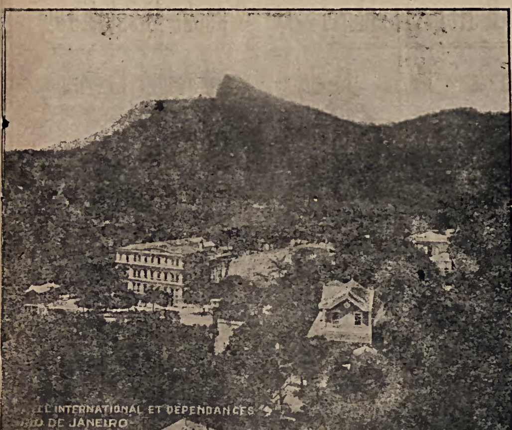
TEL INTERNATIONAL ET DEPANDAGES RIO DE JANEIRO

Angust Tribst & Klüber Rua Couto Magalhães 32 São Paulo (früher, Rua Pom Retiro) empfehl ich dem geehrten Publikum