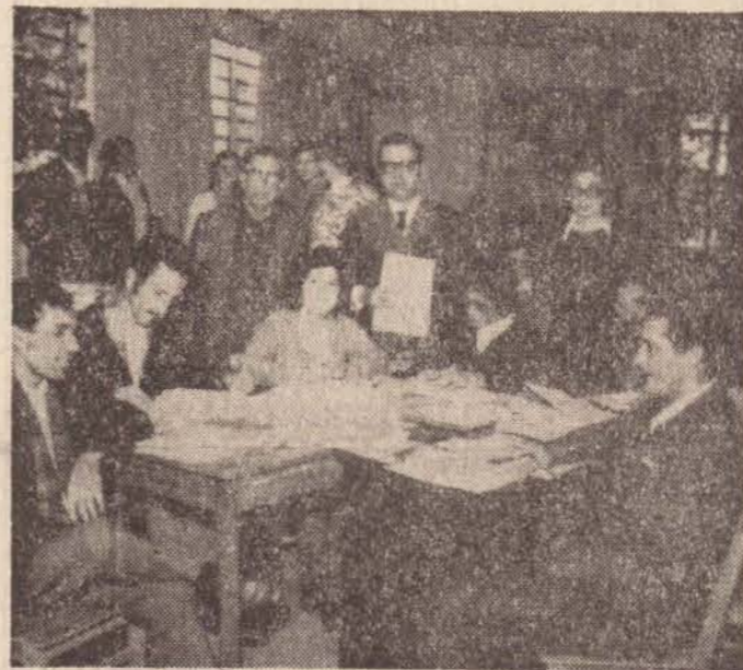
Na foto, uma parte dos alunos e na outra, os professores e monitores