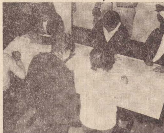
O publico faz a sua aposta na Loteria Esportiva, na Casa Lotérica Presidente Ltda.