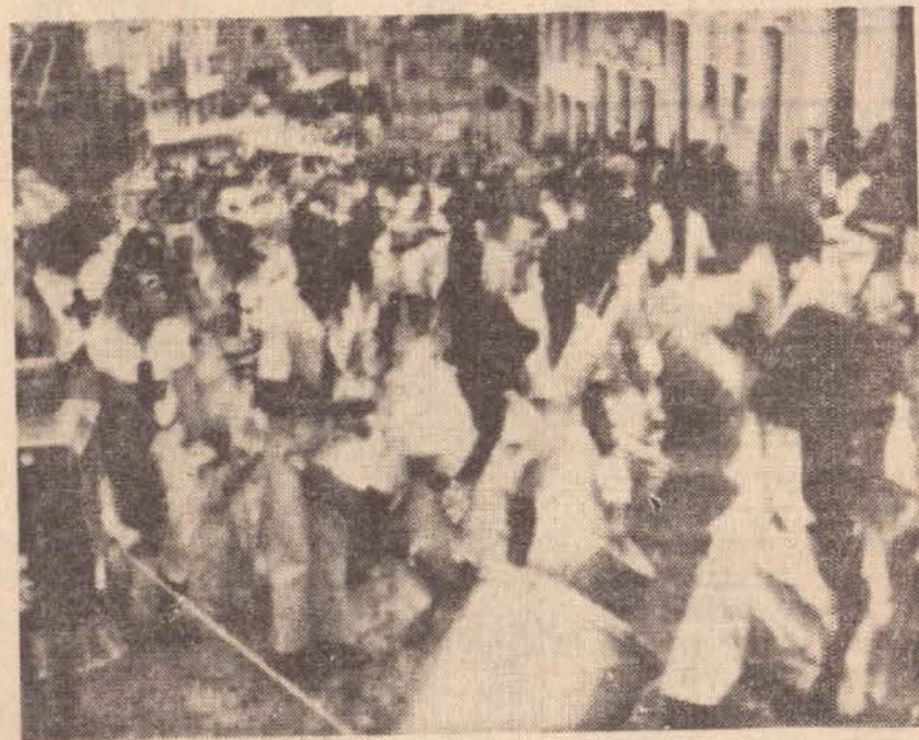
Fantasias simples e baratas, a formula baiana para a alegria.