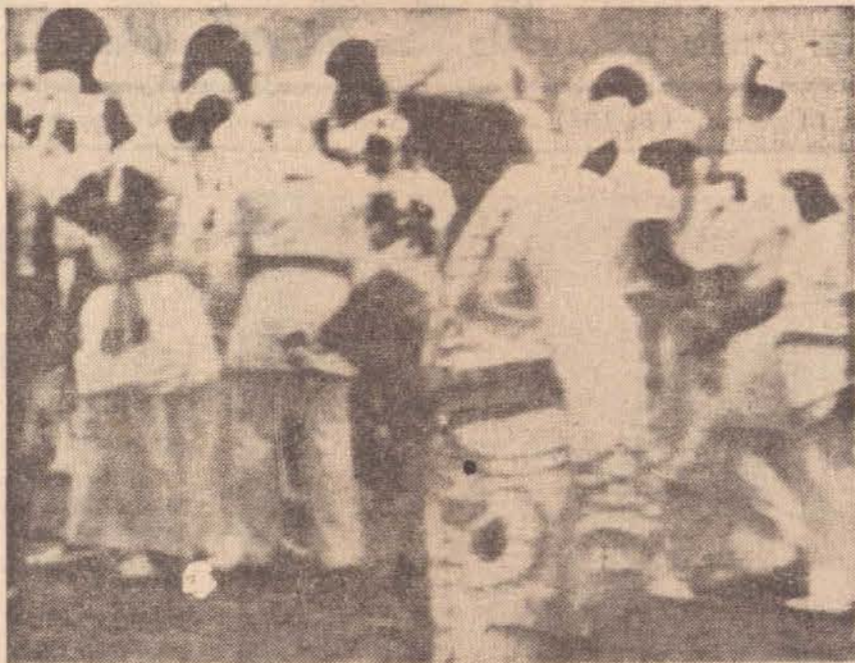
"Os filhos de Ghandi", o mais famoso bloco do carnaval baiano.

O jovem que está infernizando os carnavales nos salões vai ter muito pouco a oferecer, quando chegar a sua vez de assumir a paternidade. É fácil compreender esta assertiva. Ele não pode dar o que não recebeu. Os pais de hoje podem nutrir alguns aborrecimentos. Os de amanhã vão verter lágrimas!