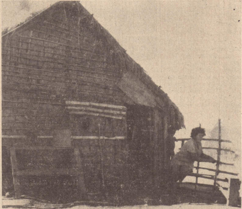
A CONTEMPLAÇÃO DO RIO, A MOVIMENTAÇÃO DAS EMBARCAÇÕES E A PASSAGEM DOS PESCADORES, SÃO O LENTIVO DE UM POVO SEM HORIZONTES.

moção Social, da Saúde e da Educação entre outras. Só podemos acreditar no êxito da iniciativa dada em Presidente Prudente pelo Secretario de Economia e Planejamento, se houver um trabalho unificado desses órgãos do governo estadual.