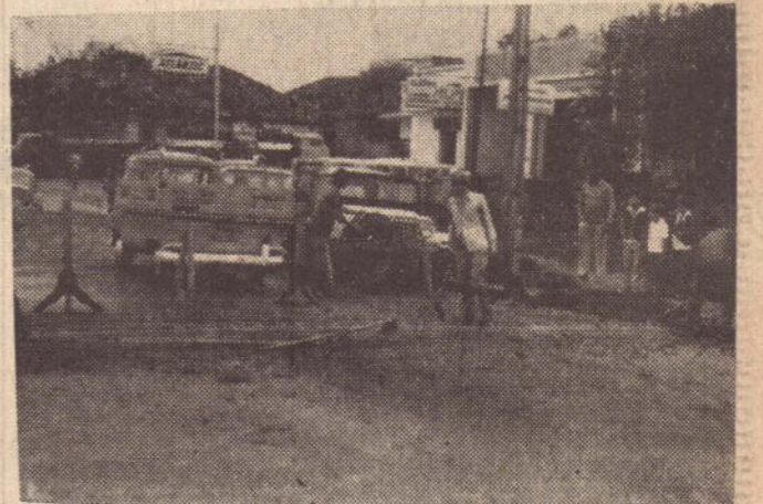
As novas tartarugas montadas na R. Antonio Rodrigues representam o primeiro obstáculo, para os que correm.