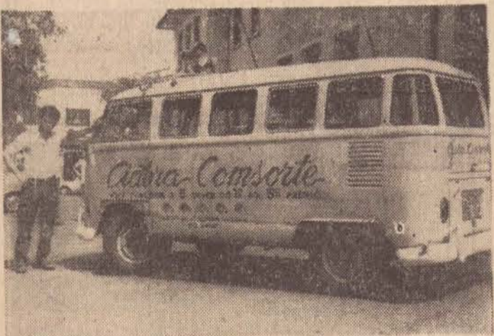
O Inspetor da Ciabra expulsou de sua equipe os vendedores desonestos.