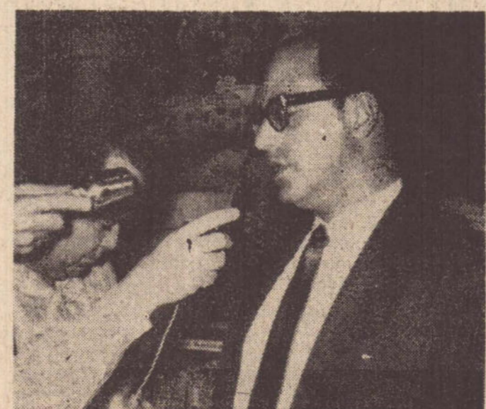
Paulo Salim Maluf concedendo entrevista quando aqui esteve à última vez.

Por outro lado diversas entidades e clubes de serviço já estão providenciando memorias a respeito.