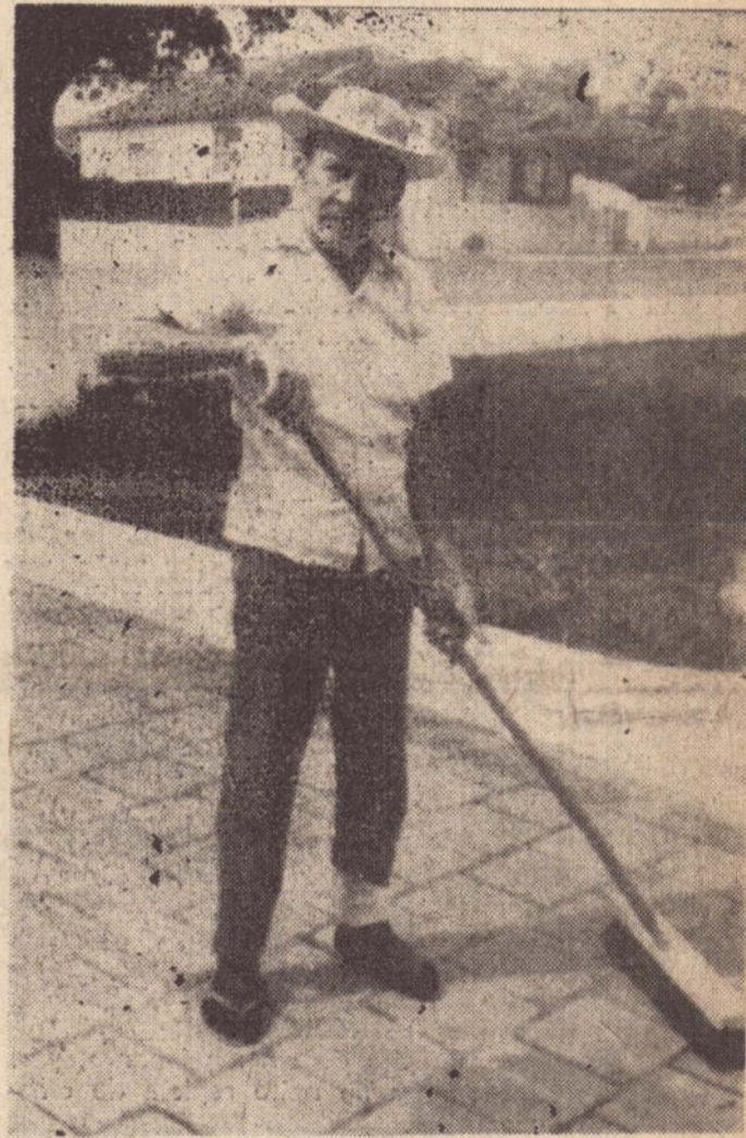
Os funcionários municipais são sacrificados com a crise dos municípios.

Quem sofre muito com a situação delicada dos municípios, são os funcionários municipais. Com os salários atrasados (na gestão anterior os de determinada Prefeitura vizinha ficaram onze meses sem receber) eles continuam trabalhando normalmente, mas com o sacrifício de ver a família doente e mal alimentada, sem nada poder fazer.