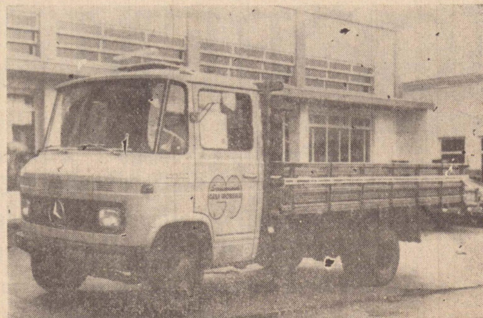
L-608 D — (MERCEDINHO) — Mais um produto da MERCEDES — BENZ DO BRASIL S.A.

RUA ANTONIO RODRIGUES, 1.330 — FONES 3-4338 e 3-4854 PRESIDENTE PRUDENTE