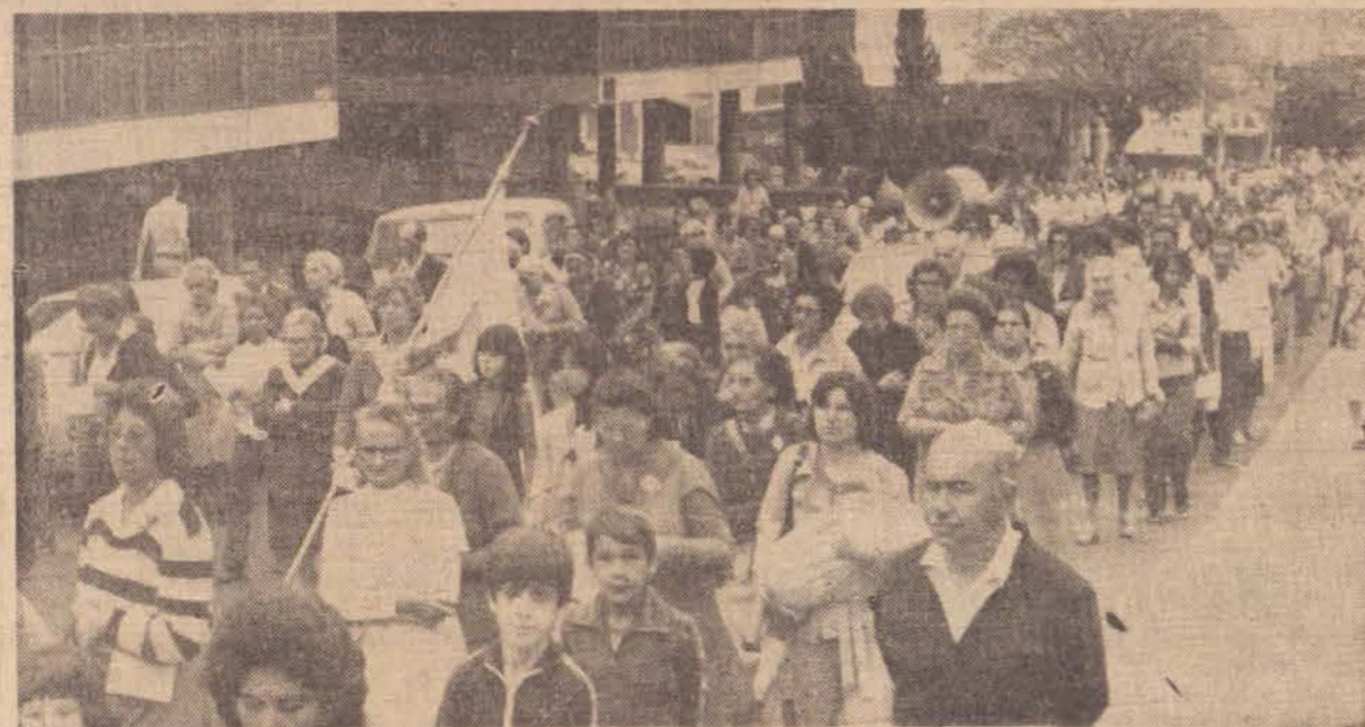
Milhares de pessoas participaram da procissão