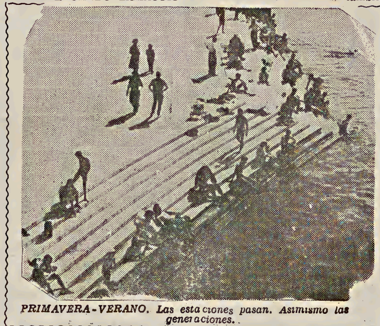
PRIMAVERA-VERANO. Las estaciones pasan. Asimismo las generaciones.