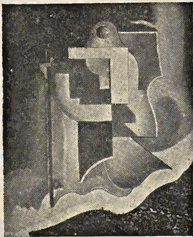
« El peregrino del pensamiento »

DIVERSAS entidades culturales de París ofrecieron recientemente un homenaje de simpatía y admiración al ilustre pintor español, exilado voluntario, Tito-Livio Madrazo, una de las auténticas glorias de la revolucionaria y discutida Escuela de París .