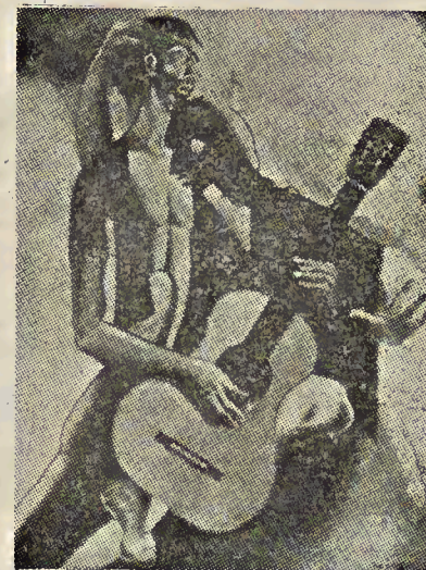
« Poema gitano »

A decir verdad, la pintura, incluso la llamada realista, ha sido siempre más o menos abstracta e idealizadora de la realidad. Jamás, en ningún lugar del mundo visible, han existido las visiones cele-