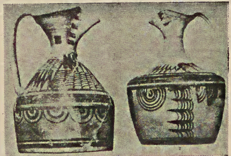
SAN MIGUEL DE LIRIA. — Decoraciones geométricas (siglos IV y III?). 1 y 2: Ochinos (De Fletcher, Corpus, Liria)