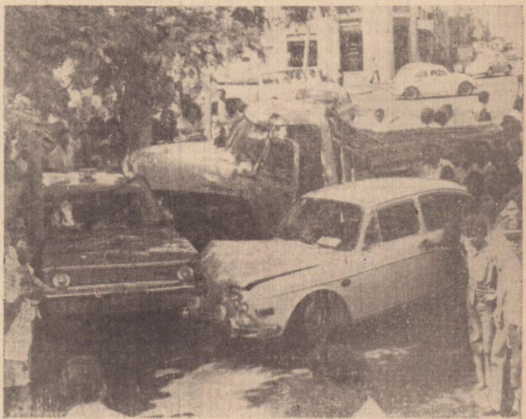
Os automoveis abalroados pelo caminhão, sofreram danos de monta.

A reportagem também encontra dificuldades em seu trabalho fotográfico e outros levantamentos. São crianças e adultos numa teimosia irritante, obrigando as vezes, os PMs agirem de modo rústico. Ontem, a aglomeração interrompeu o trânsito de outros veículos e um soldado foi atropelado, devido a falta de espaço para trabalhar livremente.