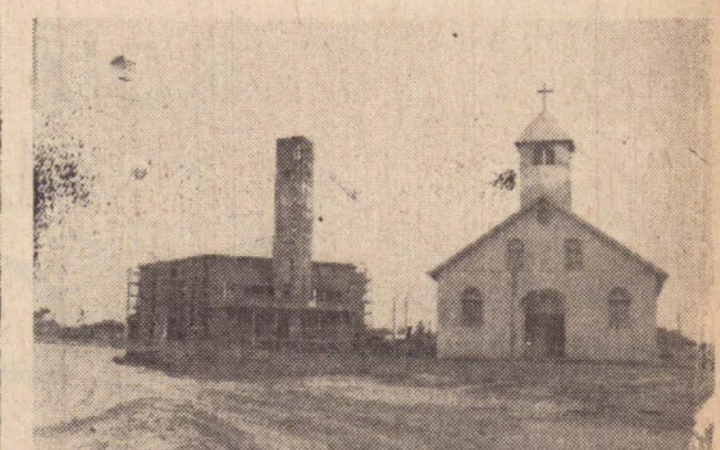
A nova matriz em construção, ao lado do atual templo católico da cidade.