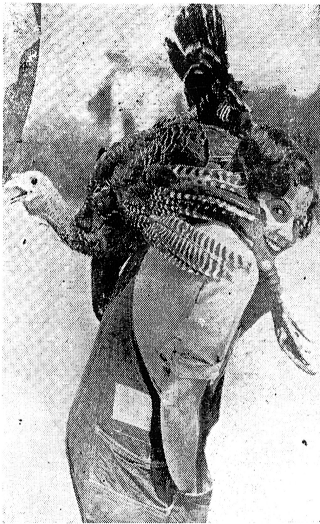
Inda a gravura si vê a Litizia molto cuntenta bringando co Pirú

O caso da Golombia c'oa Litizia che stâvano brigando pur causa do "pirú" stâ cumpretamenti arrisorvido.