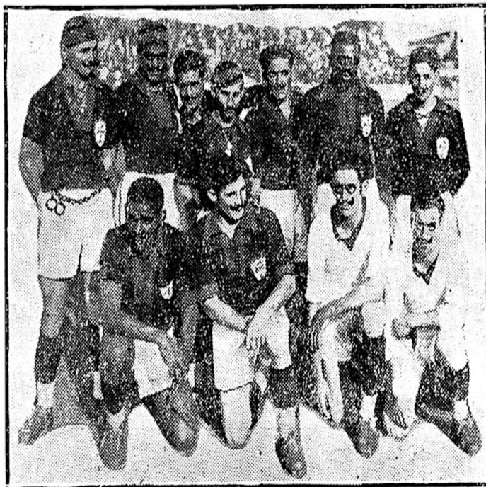
U timbre dus "Imbictos" puzando para a nossa óbju-ctiva, munutos ántes da trugéd'a sangrénta.

Mais uma bictoria acáva de cunquistari u p'quinino i balente Purtugali. Ao despois du Adamastori i du rupólho com vata-tas, só mesmo a Purtugueza d'Esportes, ai! a minha cachôpa!