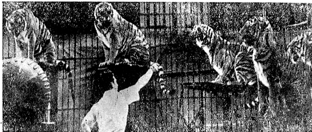
Instantanico panhádo no urtímo congresso das "isquerda arrivoluzionária"