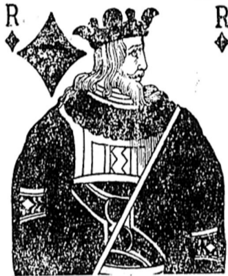
O Ré Giorgio n.º 5 da Ingraterra

Os giornale da settimana apassata impubricô uno tili-grammo da Ingraterra, che ninguê ligô, ma chi podi tê gravis cuzeguenza internazionale, divido intraduzi in suas estrellinha uno gravi ar- rangarabbo entri duos Ré di testa goroada, o minenti Ré