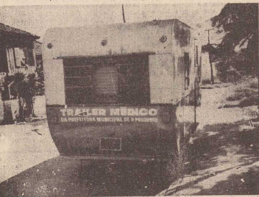
Desde as 7 horas da manhã o Trailer Médico está em qualquer ponto da cidade para atender à população.