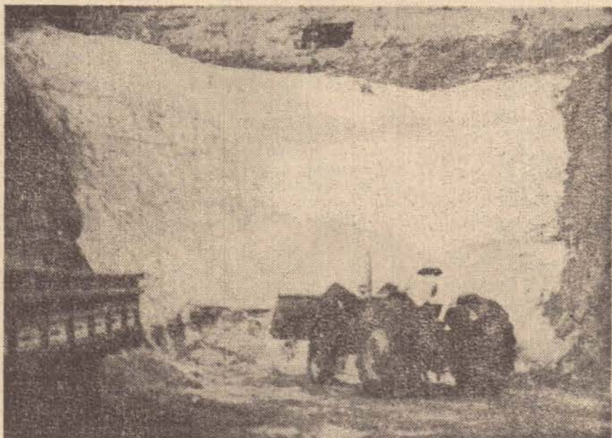
Um extenso veio de areia branca, é explorado há seis anos na Bacia do Rio do Peixe.

Há seis anos, muitas firmas especializadas em materiais para construção — na Alta Paulista e Alta Sorocabana — fazem suas aquisições de areia fina, junto aos fornecedores do Rio do Peixe, que encontram no sub-solo matéria prima abundante.