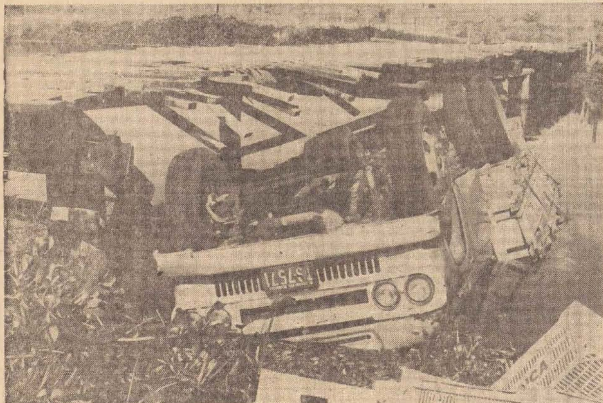
Depois desse acidente, a ponte tornou-se impraticável apesar de ser muito importante no encurtamento de distâncias na área rural, em direção à indústria da CICA.

Os prejuízos foram elevados para o veículo e perdeu-se toda sua carga.