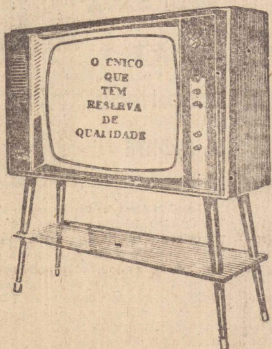
Imagem e som de presença total, com Reserva de Qualidade.