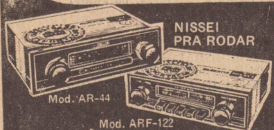
Mod. AR-44 Mod. ARF-122 Auto rádios com 4 faixas de onda de alcance mundial. Sintonia manual ou automática. FM AM 49-31 25 ms Potência de 5 watts, sem distorção e isento de ruídos e interferência. Totalmente transistorizado.