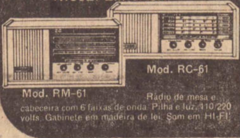
Mod. RM-61 Rádio de mesa e cabeceira com 6 faixas de onda. Pilha e Luz. 410/220 volts. Gabinete em madeira de lei. Som em HI-FI.