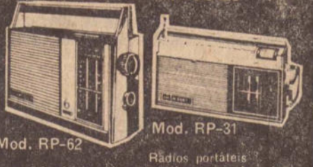
Mod. RP-62 Mod. RP-31 Rádios portáteis com 2,3 e 6 faixas de onda, inclusive com frequência Modulada. Modelos compactos e em cores atraentes. Funciona com pilhas comuns. Alcance mundial. Auto falantes especiais.

■ Enfrentar o Fluminense no Rio não é novidade para o time do Parque Antártica, habituado às grandes decisões. Os jogadores temem apenas que a arbitragem complique o seu esforço. A CBD já suspendeu um dos bandeiras que estava escalado. Dino vai manter Mário no comando do ataque e Eurico volta para a lateral direita.