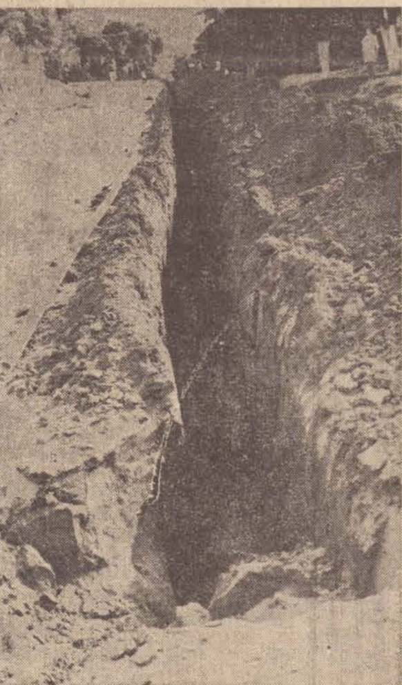
Construção da rede de abastecimento d'água em Floresta do Sul — Recursos do DAE

Em Brasília, o Ministro da Justiça, Armando Falcão, disse que o líder arenista no senado, não foge ao debate, mas deu sua opinião sobre o assunto: "Eu penso que o grande foro para o debate político nacional é o congresso, é na câmara, é no senado que os grandes temas devem ser objetos de discussão entre o governo e a oposição, ainda mais nós estamos a vésperas de uma eleição municipal, que tem a parte de irradiação pelas emissoras de rádio e televisão, regulada por lei especial, e um debate nesta altura, fatalmente e ainda que indiretamente, iria influenciar as eleições de novembro, e portanto iria violar a lei vigente, e assim deixo bem claro, e permita repetir, o Senador Petronio Portela, manifestou disposição de aceitar o debate na televisão, mas eu entendo que o debate deve continuar processando-se no Congresso Nacional".