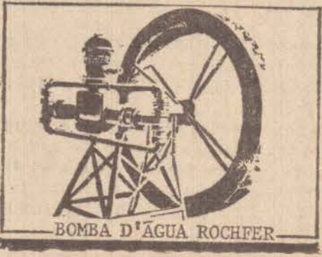
BOMBA D'ÁGUA ROCHFER

TEMOS À DISPOSIÇÃO LIANE FERRAGENS R. Tte. Nicolau Maffei, 232 - Av. Brasil, nº 2 R. José Claro, 124 - Fones: 3-4448 - 3-4613 - 3-4118