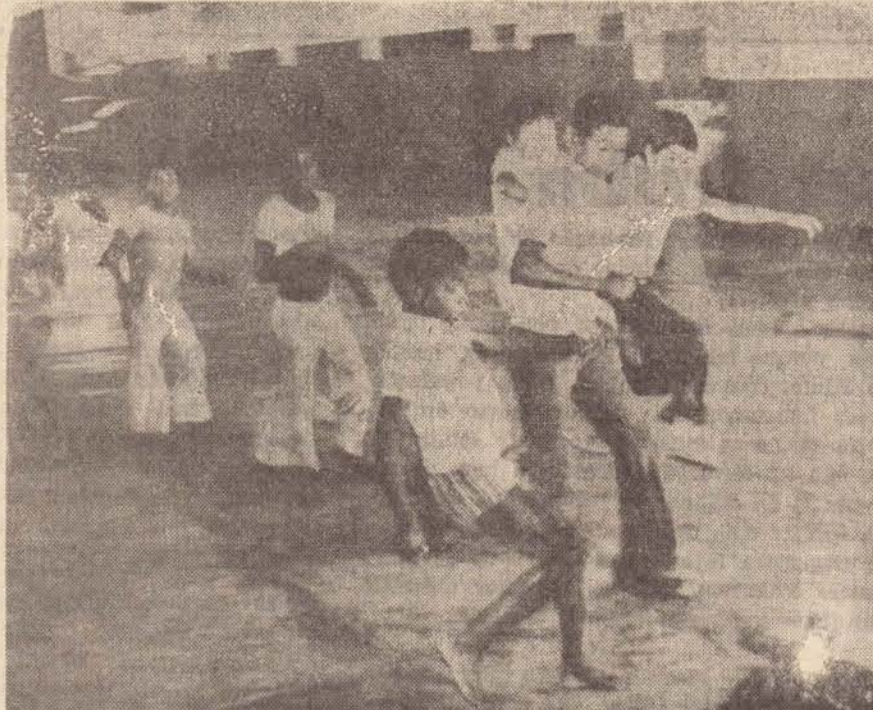
Os garotos disputando um "racha" no salão do Lar dos Meninos do Padre Leão.

A partir de Rousseau, a criança passou a ser objeto de interesse mais acurado, deixando de ser considerada um adulto em miniatura, para ser respeitada como ente com características próprias.