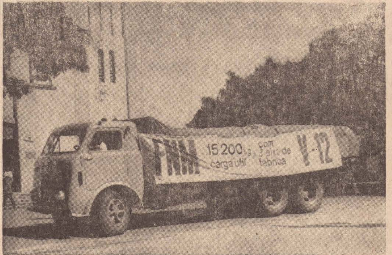
Eis o portentoso FNM V-12, defronte a Catedral de São Sebastião, onde ficou exposto para atender à curiosidade pública, principalmente dos senhores motoristas de transportes de cargas.