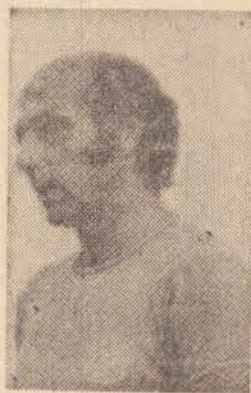
O técnico Dino Sani foi demitido ontem pela diretoria do Flamengo.

Na véspera do jogo contra o Olimpia, pela Taça Libertadores, o Flamengo demitiu ontem o técnico Dino Sani e anunciou a contratação de Nelsinho, que deixou o Fluminense no começo da semana. O presidente do Flamengo deu a versão oficial do clube para a saída de Dino: o técnico estava desvalorizando os jogadores, afastando-os por indisciplina, punindo-os sem critério e, como no caso de Mozer, responsabilizando-os por erros de setores e levando insegurança ao elenco.