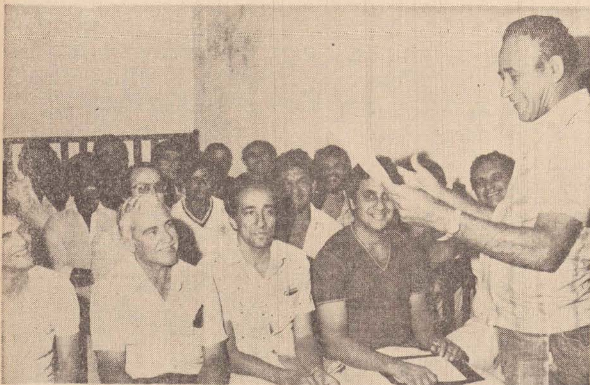
Flagrante colhido durante o Congresso Técnico realizado no último dia 16.