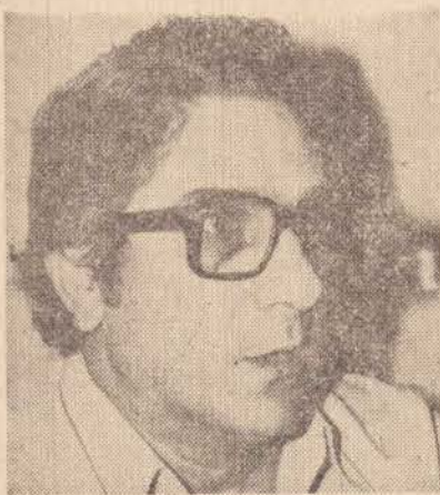
O subdelegado do trabalho disse que está havendo muita rotatividade.

Pelo levantamento fornecido pela Secretaria de Relações do Trabalho de Presidente Prudente, órgão ligado a Se-