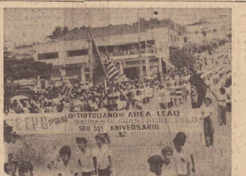
Um aspecto do desfile realizado na cidade de Santo Anastácio

Esse índice, considerado excelente pelos técnicos, não significa porém que a partir do próximo ano a paralisia infantil poderá estar totalmente erradicada na região da Grande São Paulo.