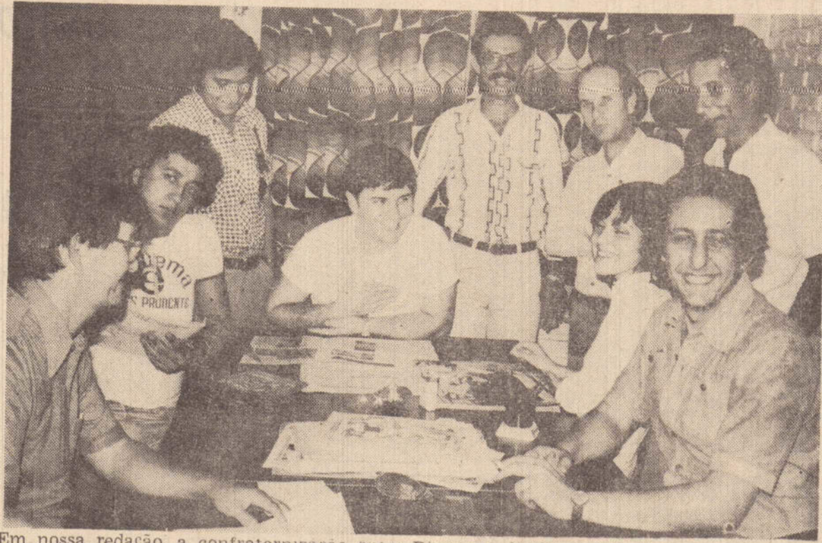
Em nossa redação, a confraternização entre Diretores do Curso Objetivo do Grupo Educacional Esquema e desta folha

devido a integral automatização do sistema, simplificando seu uso pelos assinantes, e a redução nos custos das chamadas das quais não se cobrará mais a tarifa mínima de 225 cruzeiros, exigida nas operações através das telefonistas.