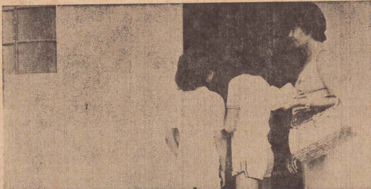
"A emoção de entrar pela primeira vez em sua casa própria"

O Conselho Monetário Nacional aprovou também os novos preços mínimos para produtos agrícolas que serão produzidos na safra 1980/81, contemplando um reajuste médio de 133 por cento, sendo que os principais produtos de alimentação (arroz, feijão, milho e mandioca) receberam elevações médias de 155 por cento. O arroz permaneceu com o preço mínimo de Cr$ 720,00 a saca de 50 quilos conforme a proposta anterior. O próprio Ministro Delfim Neto, que ontem havia demonstrado pouco interesse em aprovar este valor, decidiu ontem pela manhã voltar atrás.