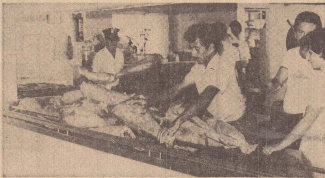
O Hospital Bezerra de Menezes recebeu 800 ks de peixes