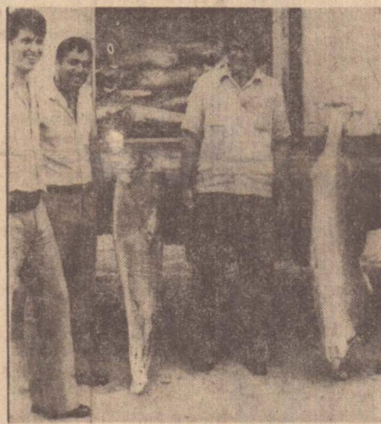
maioria dos peixes era de grande porte.

O Destacamento está informando que, consoante a portaria 562 de 13 de novembro de 1977, a SUDEPE, está proibida a pesca com qualquer arma