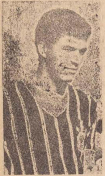
Batista que conseguiu passe livre junto ao Corinthians Paulista.

O zagueiro esquerdo Batista que pertence ao Corin-