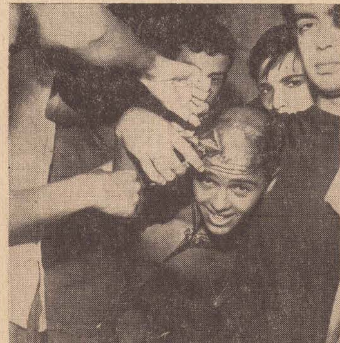
Flagrante anexo, um aluno novo, sendo vítima da brincadeira dos veteranos. (SNN).

S. PAULO — Com os calouros sendo obrigados a entrar em aula com calção e cabeça raspada, começaram as aulas na Faculdade de Direito, no largo S. Francisco, que este ano não teve problemas de excedentes, 448 alunos foram aprovados, mas as vagas eram de 450, havendo portanto, mais dois lugares. Como sempre o trote dos novos alunos foi violento, provocando a suspensão dos alunos por cinco dias, apesar disso, os calouros não reclamam, aceitam as brincadeiras e participando também delas. A classe foi suspensa, também, devendo as guerrinhas de ovos, visando principalmente os novos alunos. As moças veteranas, não participaram muito das brincadeiras, preocupavam-se mais, em proteger-se dos ovos. Mas de vez em quando davam uma olhadinha disfarçada nos calouros. Quando perguntadas, a opinião era unânime... chiiii... como são feios.