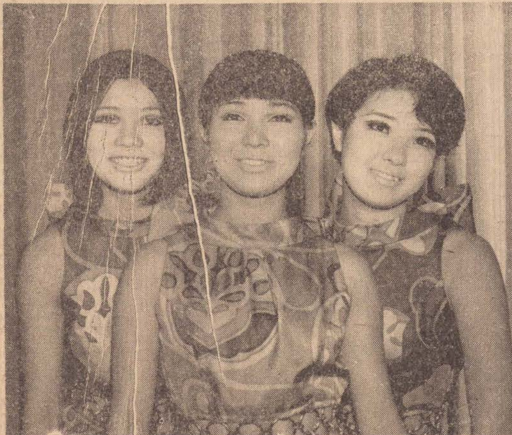
Assistimos ontem o espetáculo de estréia do Circo Mágico de Tokio. Simplesmente deslumbrante o acontecimento, só vendo para avaliar a magnitude da apresentação. Na foto, três das integrantes do Circo que além de realiza-

Hoje — vespéral às 14 e sessão única às 20.15 — proibido até 18 anos — A MANDRAGORA — Rossana Schiafino