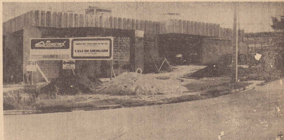
Na pista norte, próximo da Casa do Médico, está surgindo a Casa do Advogado

considera que a Casa será também um ponto de encontro dos advogados e lhes proporcionará lazer, seja pela prática de esportes, seja por possibilitar reuniões para maior con-gregamento da classe. O término das obras está previsto para o mês de outubro próximo, mas já no dia 11 de agosto, quando se comemora a data da instituição dos cursos jurídicos no Brasil, a diretoria da 29.ª Sub-Secção está pretendendo realizar, no local da construção da Casa do Advogado, a festa de confraternização dos bacharéis da região.