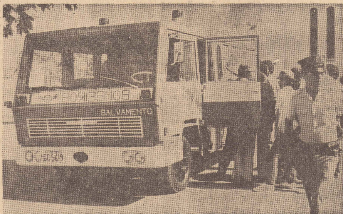
A viatura já foi utilizada ontem para resgatar um homem que caiu numa fossa