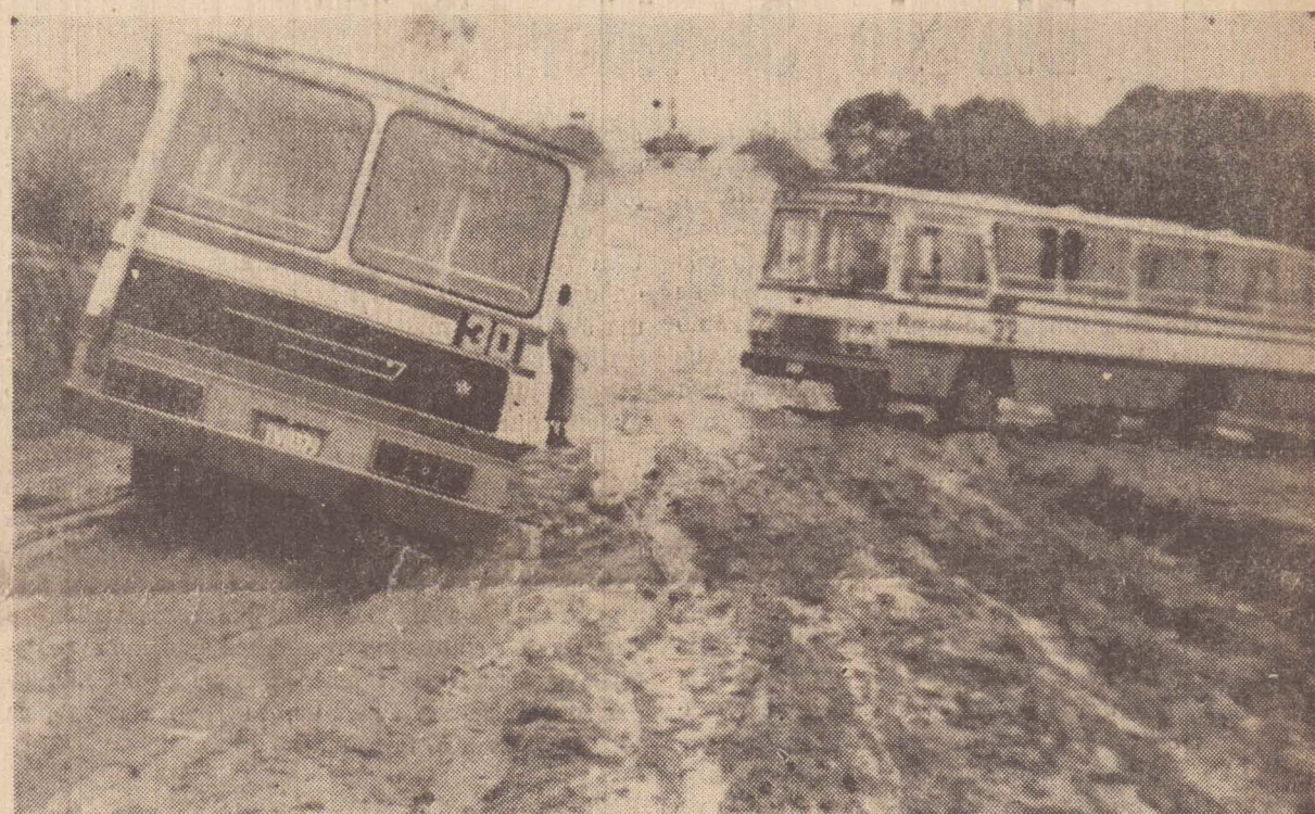
Na foto, dois ônibus que permaneceram atolados no barro.