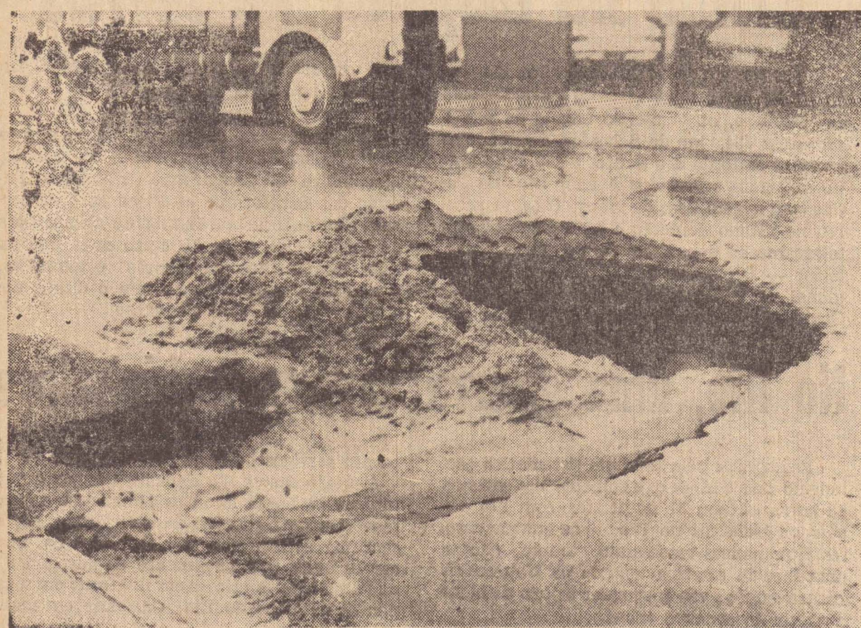
Num raio de 50 mts, há sinais de que o asfalto está solapado